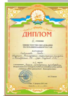
В состав эко-

группы входят студенты колледжа, которым не безразличны вопросы экологии и охраны окружающей среды нашей республики.